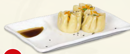
161 Ebi Gyoza* (3 pz.) € 4,50 (ravioli ripieni di carne e gamberi, sesamo)