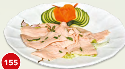
155 Salmone Marinato* € 5,00 (salmone marinato, zucchero, aceto, succo d'arancia, sale e pepe)