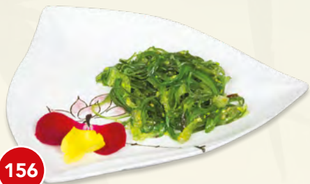
156 Goma Wakame* € 5,00 (alghe giapponesi)