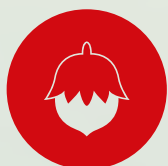
FRUTTA A GUSCIO