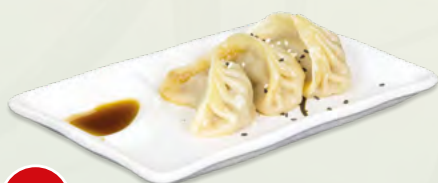
162 Gyoza* (3 pz.) € 4,00 (ravioli ripieni di carne e verdure, sesamo)