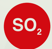
ANIDRIDE SOLFOROSA E SOLFITI