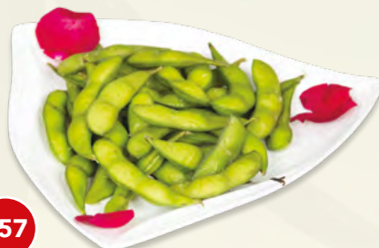
157 Edamame € 4,00 (fave giapponesi)