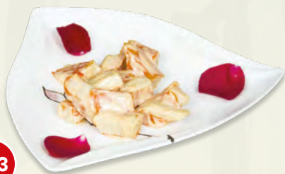
153 Antipasto di Granchio* € 4,00 (surimi di granchio, salsa cinese)