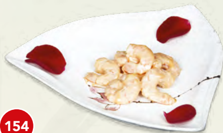
154 Cocktail di Gamberi* € 5,00 (gamberi, salsa cocktail)