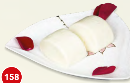
158 Pane al Vapore* (2 pz.) € 3,50 (farina di grano e latticini)