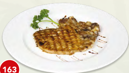
163 Braciola di maiale alla griglia* € 6,00