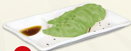
160 Gyoza Vegetarian* (3 pz.) € 3,50 (ravioli ripieni di verdure, sesamo)