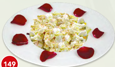
149 Insalata Cinese* € 4,50 (insalata verde, con salsa cinese)