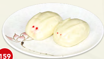
159 Pane Dolce al Vapore* (2 pz.) € 3,50 (farina di grano e latticini, ripieno crema)