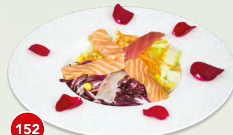
152 Insalata Mista Pesce* € 7,00 (con fettine di pesce misto)