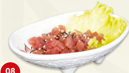
Tartare di Salmone* € 7,00 (salmone, sesamo)