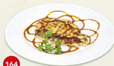
164 Petto di pollo alla griglia* € 5,00