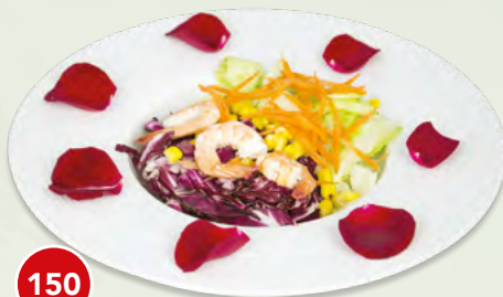
150 Insalata Mista Gamberi* € 5,00 (gamberi, mais, carote, insalate di stagione)